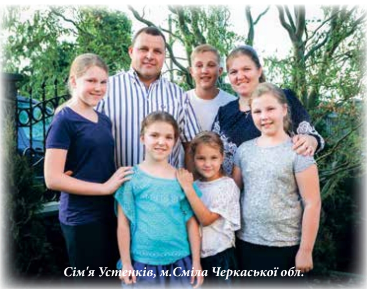
Сім'я Устенків, м.Сміла Черкаської обл.