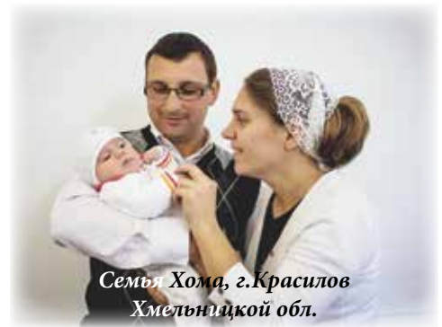
Семья Хома, г. Красиллов Хмельницкой обл.

сокие позиции по работе, им доверяют больше, чем неженатым сотрудникам. Доказано, что чем крепче любит и верит в него жена, тем успешнее человек.