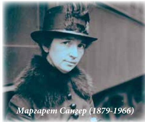
Маргарет Сангер (1879-1966)

В самом начале Второй мировой войны английское правительство обвинило основательницу британской школы планирования семьи и контроля рождаемости Мэри Стоупс в том, что «если бы не пропаганда ограничения рождаемости, осуществляемая ею в Англии,